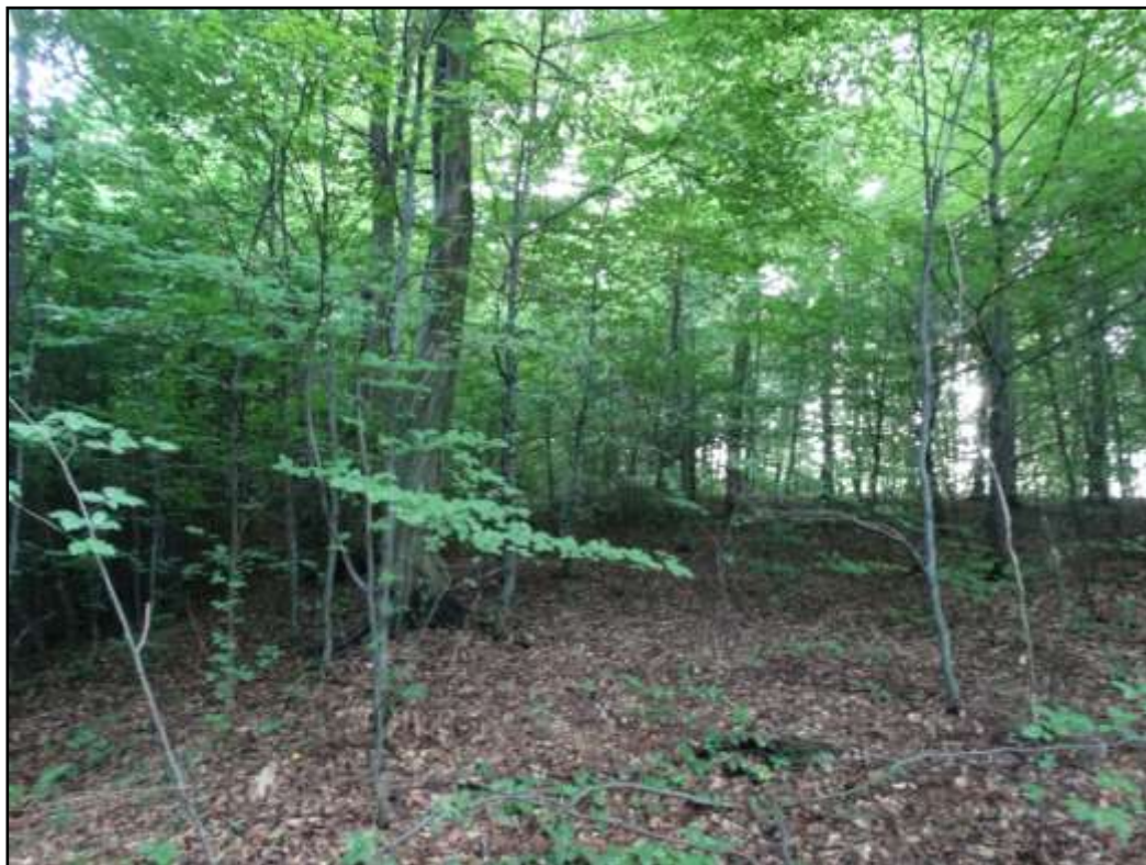
Juvenilny płat grądu typowego

pospolitą Corylus avellana . Runo zróżnicowane, ubogie w grądzie typowym i wysokim, znacznie bogatsze w grądzie niskim, nawiązujące do runa łągowego. Uboższe płaty charakteryzują się występowaniem gatunków acydofilnych, typowych dla siedlisk mezotroficznych, w tym kosmatki gajowej Luzula luzuloides . Występuje tu także nieczelnica szerokolistna Dryopteris dilatata , gajowiec żółty Galeobdolon luteum , podagrycznik pospolity Aegopodium podagraria oraz nalot drzew i krzewów.