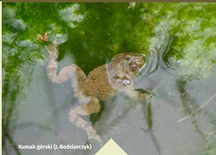
Kumak górski (J. Bodziarczyk)

W bogatym wielogatunkowym runie obok roślin charakterystycznych dla buczyn rosną gatunki chronione, m.in.: buławnik mieczolistny – Cephalanthera longifolia , bluszcz pospolity – Hedera helix , wawrzynek wilczełyko – Daphne mezereum , przyłaszczka pospolita – Hepatica nobilis , a na glebach mezotroficznych także konwalia majowa – Convallaria majalis .