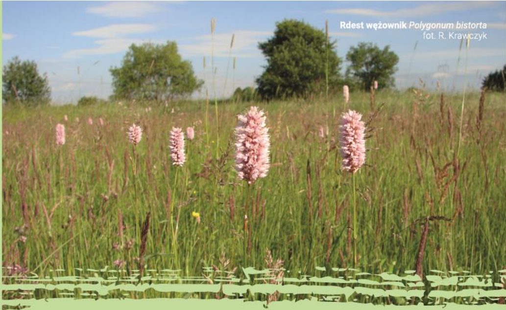
Rdest węzownik Polygonum bistorta