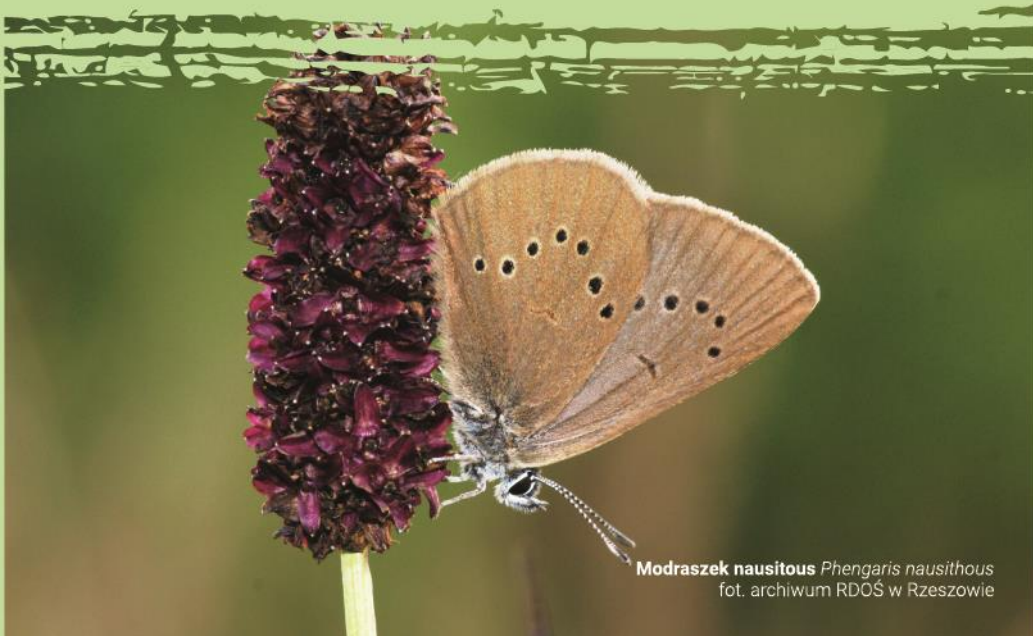
Modraszek Phengaris nausithous

Celem ochrony obszaru Natura 2000 Dolina Dolnego Sanu PLH180020 jest zachowanie mozaiki siedliskowej charakterystycznej dla większych dolin rzecznych oraz utrzymanie populacji i właściwego stanu siedlisk gatunków z załącznika II Dyrektywy siedliskowej.